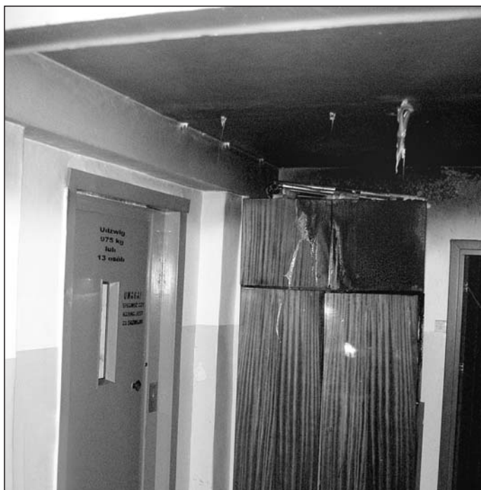
Spalona szafa – powód strachu, szkód i poważnej akcji strażaków.

Ten przypadek świadczy, że wszelkie materiały łatwopalne – w połączeniu z nieostrożnością lub bezzmysłnością ludzi – stanowią zagrożenie dla osób przebywających w budynku. (ZJ)