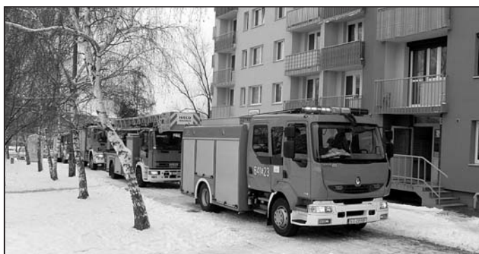
Do pożaru przyjechały cztery wozy straży.