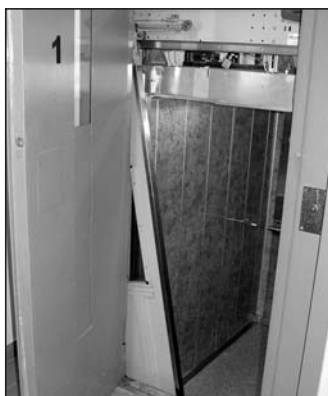
Sprawca zniszczenia windy został ujęty i ukarany.

Dziękujemy naszemu pracownikowi za odwagę i właściwą postawę godną naśladowania (zastrzegł, aby nie podawać jego nazwiska) oraz czujnym i pomocnym sąsiadom.